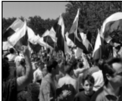
Fiesta en los jardines

En este gran momento no se intenta explicar nada, sino simplemente describir las lágrimas, los rostros, el sudor y los cuerpos de cada persona que se masifica en un estadio y se transforma en una expresión de vida.