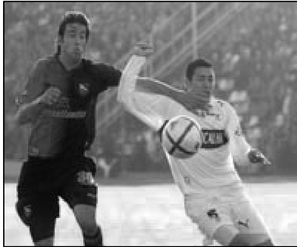
Partido clave para el Lobo en el Bosque.

El árbitro para esta tarde será Horacio Elizondo.