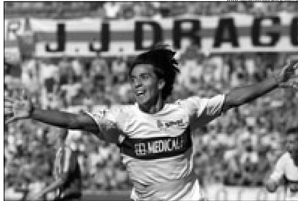
Brazos al viento de Lobos y comienza la alegría.