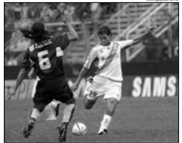
El Lobo cierra un torneo extraordinario.