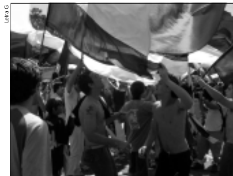
Los jardines del Estadio del Bosque fueron una fiesta.