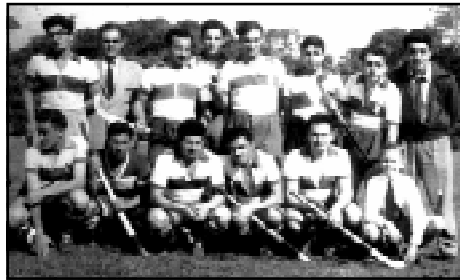
El equipo de reserva que participó en la A.A.H.

Por todo esto se puede decir que el hockey surgió como iniciativa de algunos triperos amantes de este deporte.