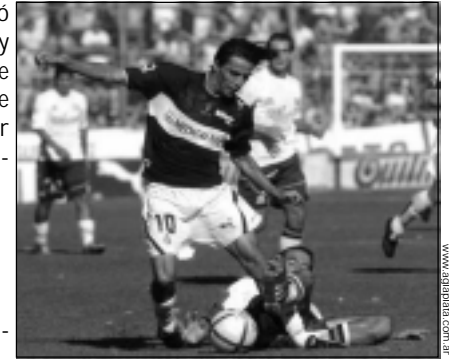
Lobos: figura en los últimos partidos.

Qué momento! Muchos tuvieron los peores recuerdos, otros estallaron de bronca y unos pocos continuaron gritando para desahogar