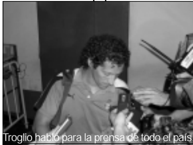
Troglio habló para la prensa de todo el país.

Por otra parte, para quitarle un poco el dramatismo que habían instalado algunos periodistas afirmó: “No me parece que sea un desastre todo, hace tres fechas que estamos en la punta y uno va a seguir dando batalla hasta el final”