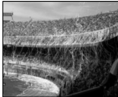
Monumento a la hinchada

Nadie recordará con claridad las toneladas de papeles en el Bosque ni los miles y miles de rollos de papel lanzados al aire en el Monumental. Nadie recordará con detalles los festejos en la Autopista, las cabinas copadas por los hinchas, las banderas envueltas en gritos, los bombos y los fuegos artificiales. Pero también hay que decirlo, nadie pretenderá que lo recuerden, por que no hace falta, por que hace casi ciento veinte años que las generaciones guardan en sus recuerdos más íntimos los mejores momentos del Lobo, sin que nadie se los tenga que recordar.