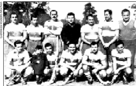
El primer equipo de hockey de Gimnasia