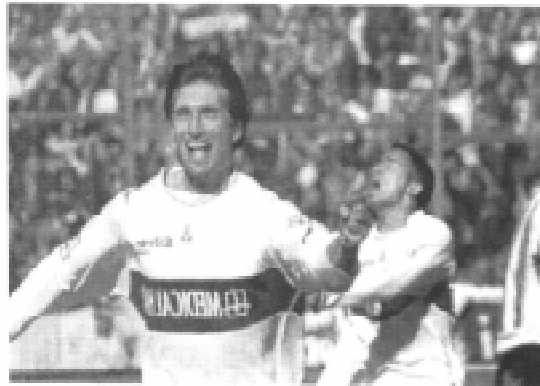
Aquella tarde el "Caio" metió dos

Con la cabeza puesta en el nuevo partido, el Lobo debe salir a hacer lo que cabe. Jugar con criterio, meter mucha garra en el medio campo y ser solidario entre los compañeros. Siempre se espera encontrar a los jugadores inspirados y sin participación en el juego sucio que propone el rival. De esta forma esperar, si es posible, una victoria y si no, al menos un punto.