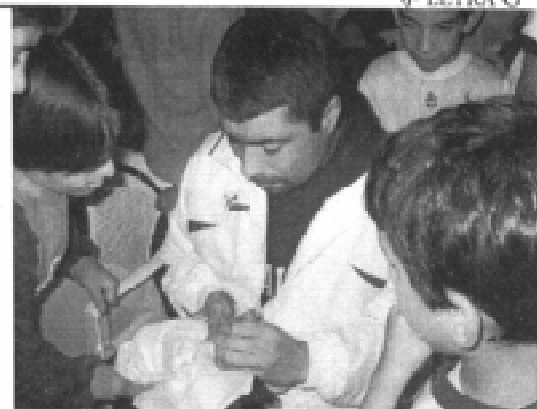
El "Coco" fue el protagonista: firmó autógrafos toda la noche

Finalmente, antes de cerrarse el acto se infor-