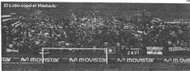
El Lobo copó el Viaducto

Por otro lado, hay que destacar que es muy po-