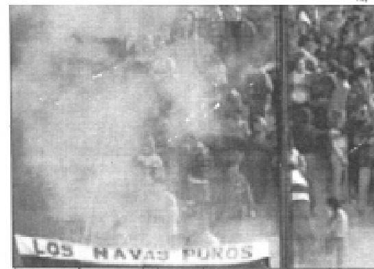
Los gases fueron arrojados en el acceso a la tribuna visitante

Evidentemente los cálculos fueron erróneos. Nadie se imaginó o se quiso imaginar que llegaría tanta gente al mismo tiempo a sacar las entradas por lo que a minutos de comenzar el partido, se encontraban en la puerta cerca de 2000 personas. A esto hay que sumarle que la disposición de las boleterías fueron un desastre. Había cuatro personas vendiendo localidades en un espacio muy reducido